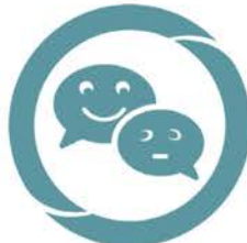
TUTELLES Gestion des Majeurs protégés