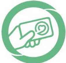
M-GAP Gestion administrative du patient, résident, usager