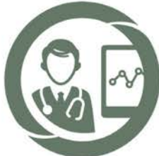
M-PMSI Saisie, contrôle et valorisation des données PMSI