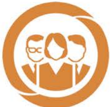
M-GRH Gestion des ressources Humaines • Paie