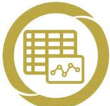
PILOTAGE Tableaux de bord et mesure de la performance