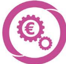
M-GEF Gestion économique & Financière