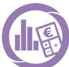
COMPTA-ANA Diagnostic Économique