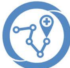
FIPS Optimisation des chemins cliniques

www.mediane.tm.fr +33(0) 494 862 862 commercial@mediane.tm.fr